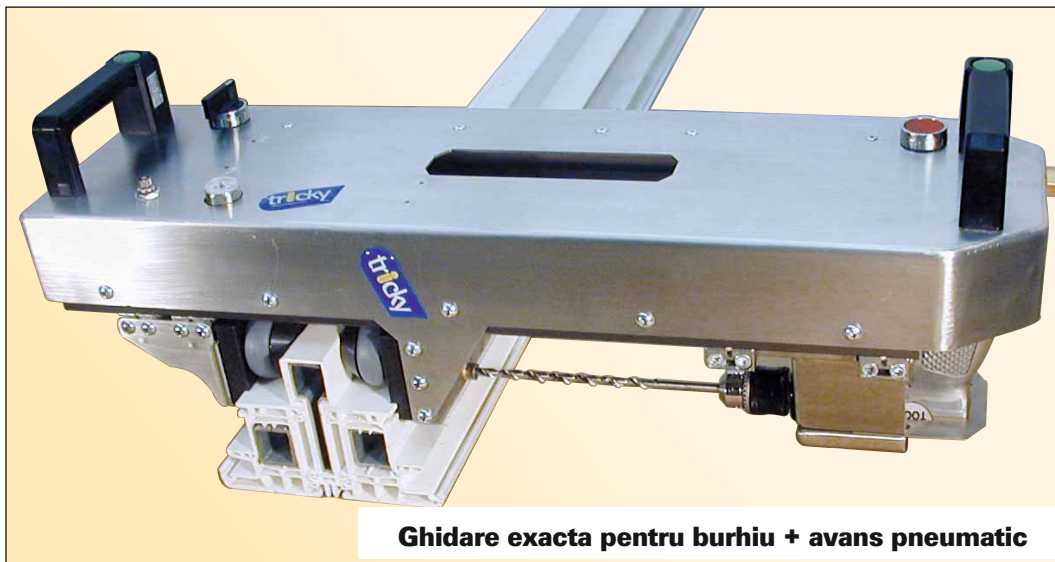
Ghidare exacta pentru burhiu + avans pneumatic

DISPOZITIV MANUAL DE GAURIT CU ACTIONARE ELECTROPNEUMATICA pentru gaurirea imbinarilor din elemente de tamplarie PVC si Al