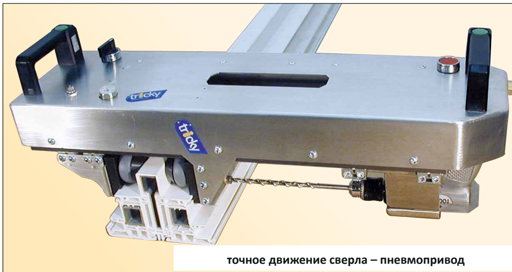
точное движение сверла – пневмопривод

электропневматический ручной сверлильный агрегат для сверления стыков оконных элементов